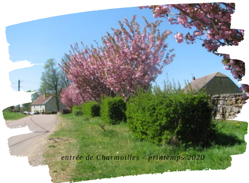
entrée de Charmoilles - printemps 2020

A l'heure où ce nouveau bulletin s'édite, les mots de couvre-feu et de confinement sont à l'ordre du jour. Ces restrictions, je le sais, impactent bon nombre d'entre vous dans leur quotidien mais je sais pouvoir compter sur votre responsabilité dans l'application quotidienne des gestes barrières . Maintenant plus que jamais, l'attention que l'on porte aux autres est essentielle : la solidarité et la citoyenneté doivent continuer à être notre fer de lance.